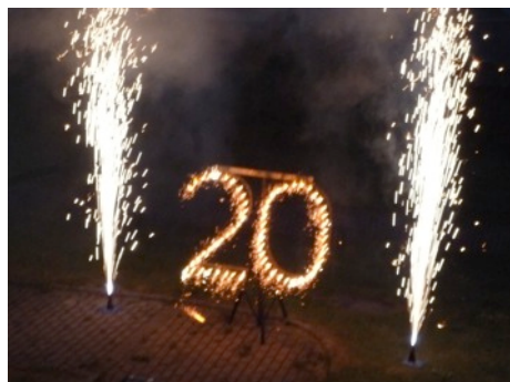
20 Jahre Barbara-Uttmann-Stift – zum Ehrentag gab es ein Feuerwerk

Bildmaterial: Die Impressionen senden wir auf Anfrage gerne in hoher Auflösung zu.