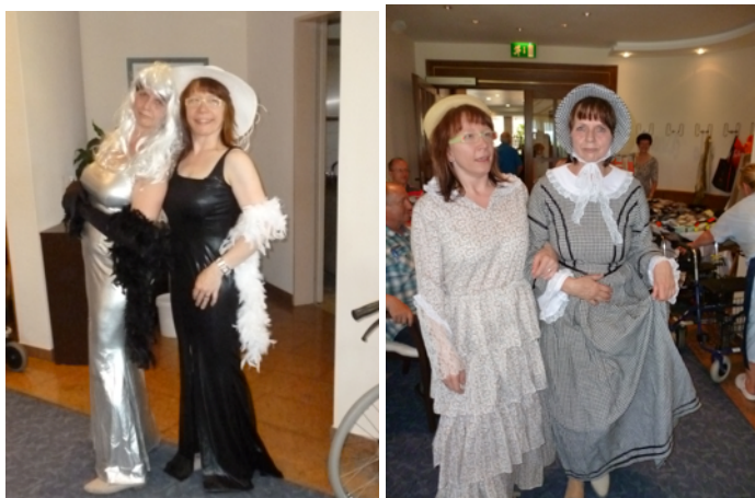
„Historische Models“ : die Kolleginnen Vorname Name und Vorname Name